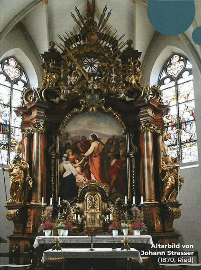
Altarbild von Johann Strasser (1870, Ried)

Im Mittelpunkt des Altarbildes: Apostel Jakobus der Ältere Schutzpatron der Pilger