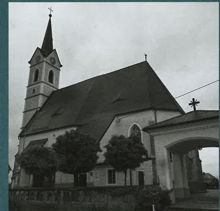
Spätgotische Kirche (seit 1350) in Roitham

Kulturhauptstadt Europas SALZKAMMERGUT 2024