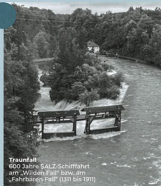
Traunfall 600 Jahre SALZ-Schiffahrt am „Wilden Fall“ bzw. am „Fahrbaren Fall“ (1311 bis 1911)