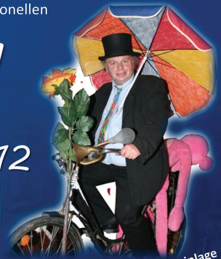
Eröffnungs- u. Mitternachtseinlage Tortentombola