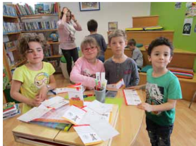
Die Kinder tragen ihren Namen in den Bibliotheksführerschein ein

Di 9.00 – 12.00 Uhr, Do 17.00 – 19.00 Uhr So 09.30 – 11.00 Uhr an Feiertagen geschlossen