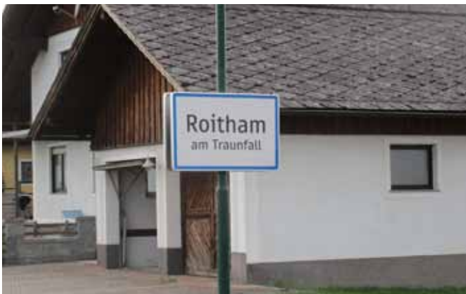
Die neuen Ortstafeln „Roitham am Traunfall“ wurden nun an allen Einfahrtsstraßen aufgestellt.