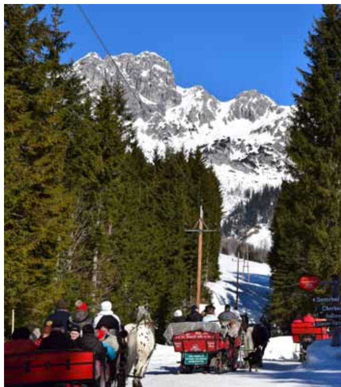
Pferdeschlitzenfahrt zur Unterhofalm in Filzmoos

Das Verteilerzentrum ist mit den modernsten Einrichtungen ausgestattet. Alleine bei der Sortierung der vielen Pakete und Briefe kamen wir aus dem Staunen nicht heraus. Anschließend konnten wir beim Chocolatier Wenschitz beim Kauf