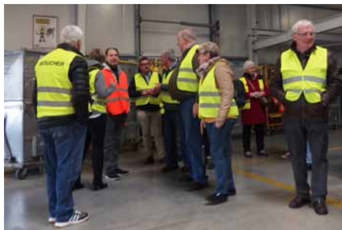
Gewaltige Logistik im Verteilerzentrum in Allhaming