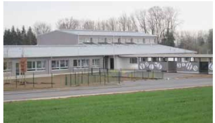
Die Schüler sind seit den Osterferien in der neuen Schule

Mobil 0699 1149 7306 von Montag bis Freitag für Sie da - nach telefonischer Voranmeldung bitte