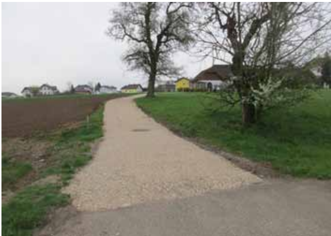
Sicherer Schulweg: der Verbindungsweg Aufeldstraße zur Pfarrhofstraße wurde neu befestigt