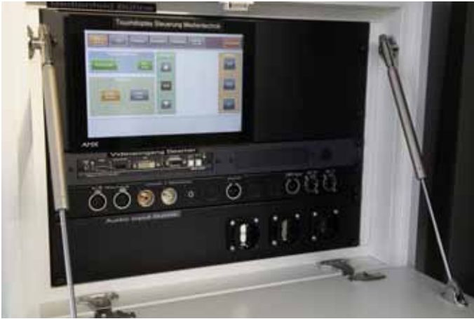
Modernste Medientechnik in Schule und Turnsaal

ne Musik einspielen. Zum anderen kann der Turnsaal als Veranstaltungsraum für Konzerte und Lesungen genutzt werden. Deshalb ist die Musikanlage so ausgelegt, den Saal als Ganzes oder eben nur in Teilbereichen zu beschallen. Ein besonderes Extra bietet der Saal noch für