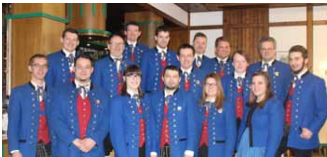
Der neu gewählte Vorstand des Musikvereins Roitham

15. Juni: Standkonzert am Raiffeisenplatz 09. Juli: Jakobi Frühschoppen am Asi Parkplatz