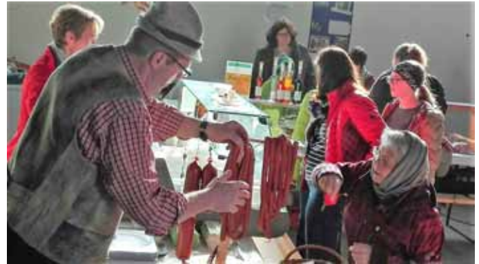
Der Bauernmarkt findet in der ehemaligen ASI jeden ersten Freitag im Monat von 15:00 - 18:00 Uhr statt

Bauernmarktgutscheine sind im Hofladen von Familie Prötsch erhältlich oder unter 0681/81844188 und