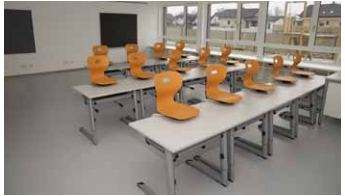
Eine der sechs neuen Volksschulklassen