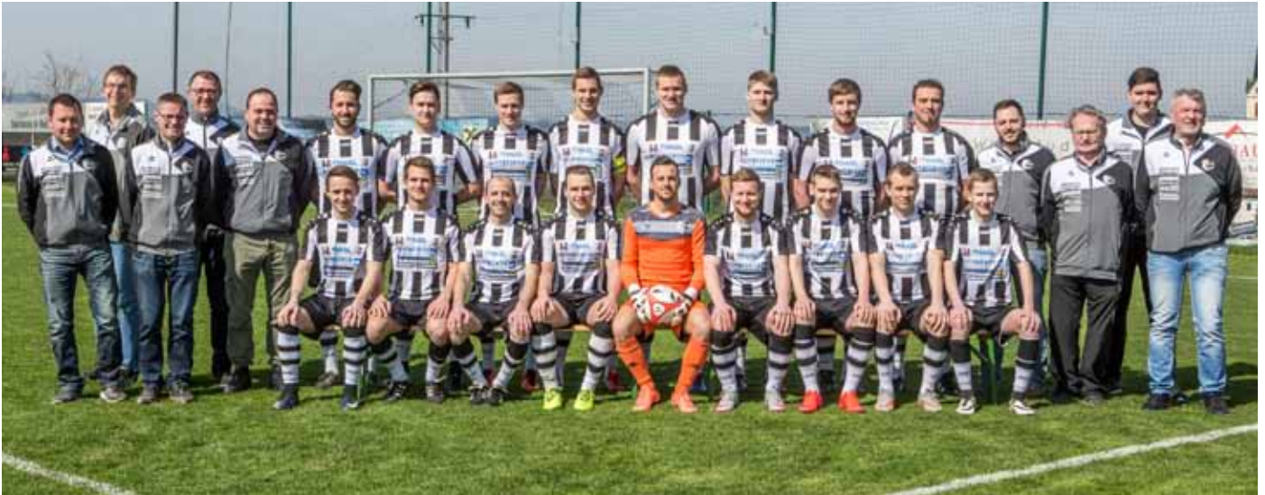
Die Kampfmannschaft des SV promot Roitham im Frühjahr 2017