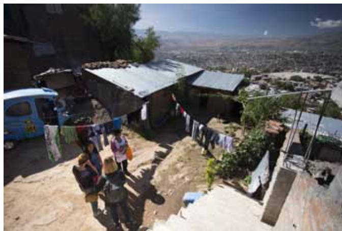
Die Arbeiterinnen in der peruanischen Andenstadt Ayacucho wohnen in ärmlichsten Verhältnissen.

Von Roitham nach Ayacucho (über 3500 m ü. M.): In der peruanischen Andenstadt Ayacucho, einer der ärmsten Regionen Perus, arbeiten, plaudern und stricken ca. 150 Frauen. Diese „Mamas“ sind Teil eines Sozialprojektes und bekommen für ihre Arbeit eine Fixanstellung, fairen Lohn und bei Bedarf auch Kinderbetreuung und