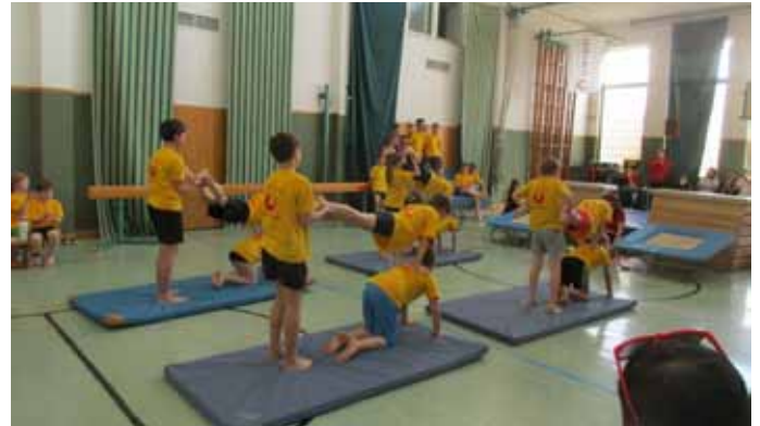
Union Schauturnen (noch im alten Turnsaal): Viele Kinder stellten auch heuer wieder ihr Können unter Beweis

Am 18. April ist wieder ein Erste-Hilfe-Kurs für Führerscheinneulinge gestartet. Ein Selbstverteidigungskurs ist in Planung. Im Herbst findet in der neuen Schule wieder ein Yoga-Kurs statt.