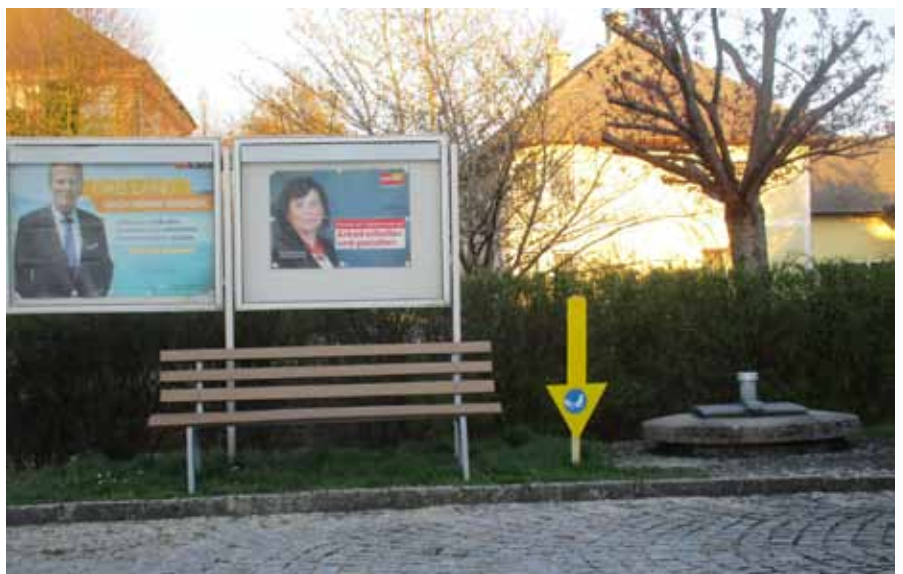
Die Gemeinde wird in Zukunft mit diesen gelben Pfeilen auf Hundekot von undisziplinierten Hundebesitzern hinweisen.

Birgit Gerstorfer: noch 170 Jahre bis zur Gleichstellung ..... 28