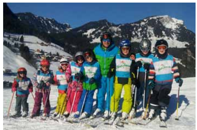
Viel Spass und herrliches Wetter beim Kinderskikurs

Terminvorschau: Ferienprogramm im Juli: Fahrt zur Kletterwand Laakirchen (Ausschreibung folgt)