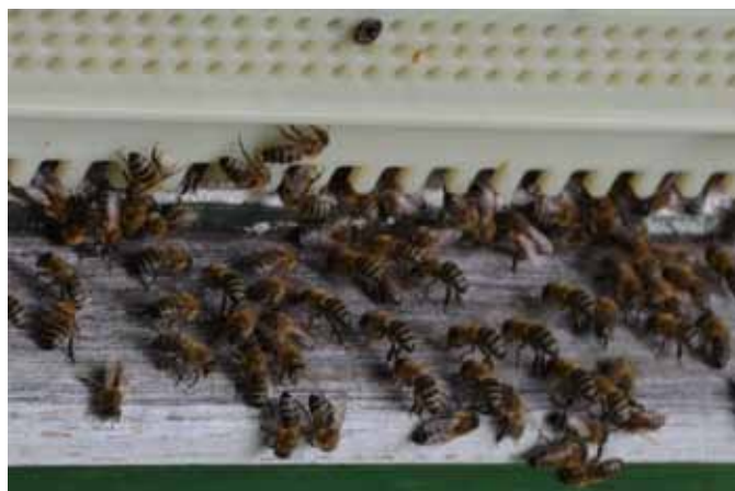
Das Flugloch im Bienenstock

verarbeitet und in die Zellen abgefüllt werden.