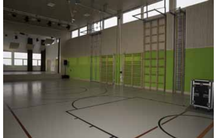
Der neue Turnsaal ist mit qualitativ hochwertigen Turngeräten ausgestattet - im Hintergrund kann man die Bühne erkennen

schusses für das leibliche Wohl sowie allen andern, die mitgeholfen haben ein tolles Fest zu veranstalten.