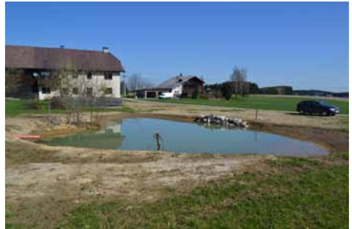
Das Biotop in Vornbuch wurde im Auftrag der Gemeinde ausgebaggert und dient auch als Löschwasser-Reservoir

Vor Beginn wurden in Abspra- che mit dem Bürgermeister, Straßenausschussobmann, Energie AG und Ploier & Hörmann die Positionen der Verteilerkästen und die Lage der Leitungen bestimmt. Es wurde auch die Straßen- wiederherstellung für jeden einzelnen Straßenzug (As- phaltierungen) festgelegt.