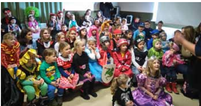
Kinderfasching im Pfarrheim: die Kinder lauschen aufmerksam dem Kasperl, der über ein spannendes Abenteuer erzählt