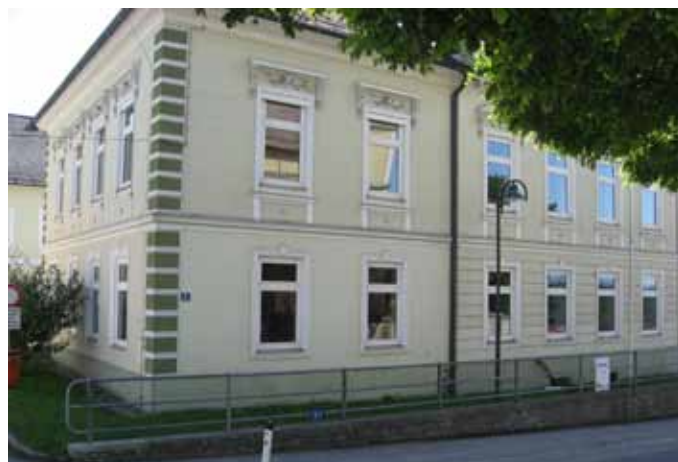
Was wird aus der alten Volksschule? Seit Ostern steht sie leer.

Bei der Evaluierung durch die AUVA wurden in den Kindergartenräumen zu hohe Schallpegel festgestellt. Für die notwendige Reduzierung durch eine Dämmung haben wir bereits Angebote eingeholt. Die Umsetzung wird voraussichtlich im August erfolgen.